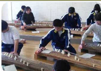
1年生お琴の体験授業