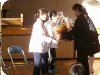
給食週間給食朝会